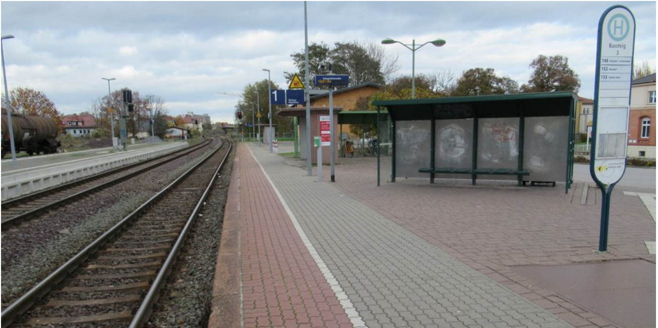
Während der Mittelbahnsteig schon modernisiert ist, warten der niedrige Bahnsteig 1 und dessen Ausstattung noch auf eine Erneuerung.