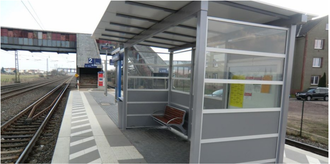
Der Bahnsteig ist fertig, 2019 folgt die Sanierung der Fußgängerüberführung