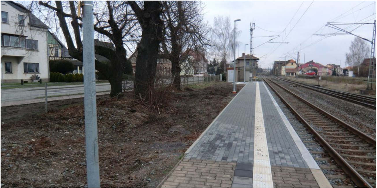
An den verlängerten Bahnsteig 1 passen nun auch zweiteilige Triebzüge.