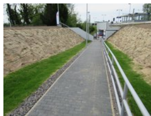
Die Zugänge zum Bahnsteig sind jetzt durch Rampen barrierefrei.