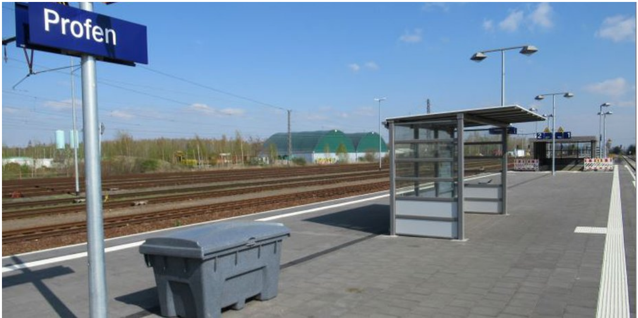
Die neuen Verkehrsanlagen sind seit Mai 2019 für die Fahrgäste nutzbar.