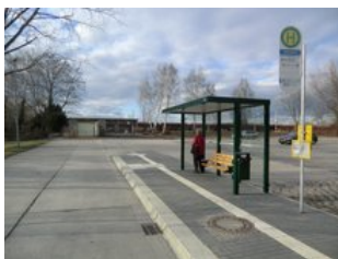
Die Bushaltestelle sorgt für einen schnellen Übergang zwischen Bahn und Bus, auf dem Vorplatz gibt es ausreichend Park+Ride-Stellplätze.