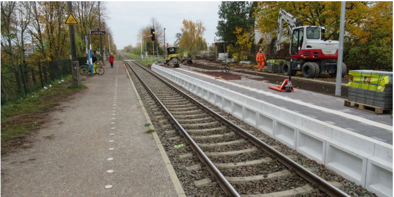
Im Herbst 2021 war der neue Bahnsteig in Bau, die Eröffnung erfolgte anschließend im Dezember.