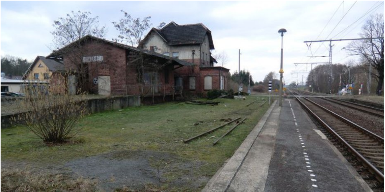
Die Bahnsteige in Mühlanger sind dringend sanierungsbedürftig