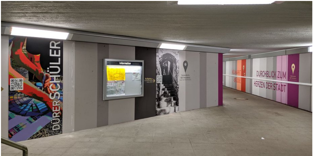
Im Oktober 2019 wurde die bislang graue Unterführung durch Schüler der Albrecht-Dürer-Schule neugestaltet