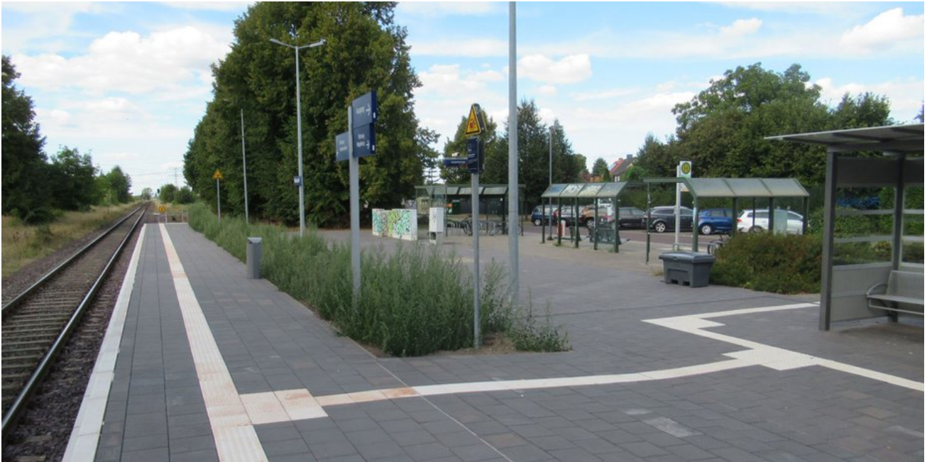
Der Bahnsteig wurde am durchgehenden Gleis neu errichtet, das frühere Gleis wurde für die barrierefreien Zugänge überbaut.