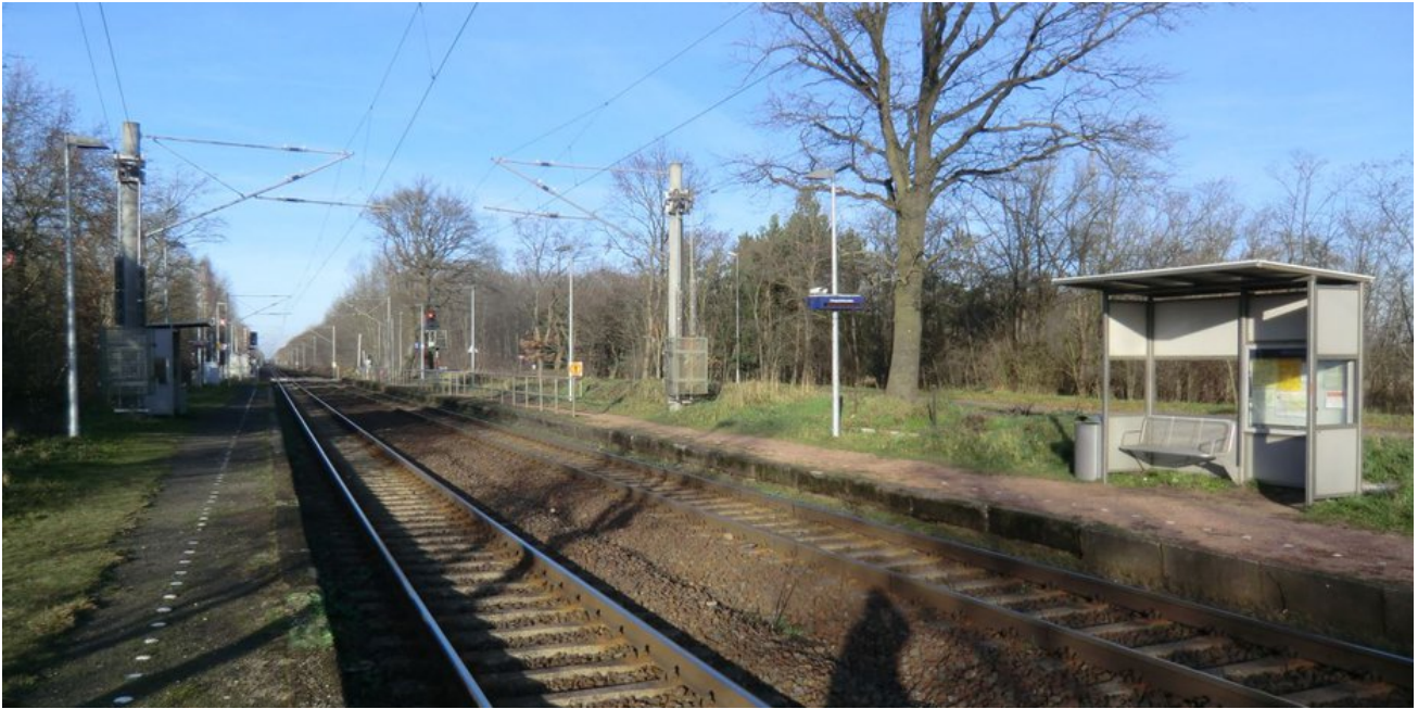
Die beiden Außenbahnsteige benötigen dringend eine Modernisierung.