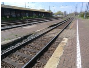
Die Planung für die Erneuerung der Bahnsteiganlagen ist angelaufen.

Projekt Bahnhofsgebäude (REVITA) Revitalisierung Bahnhofsgebäude durch eine Bürgergenossenschaft