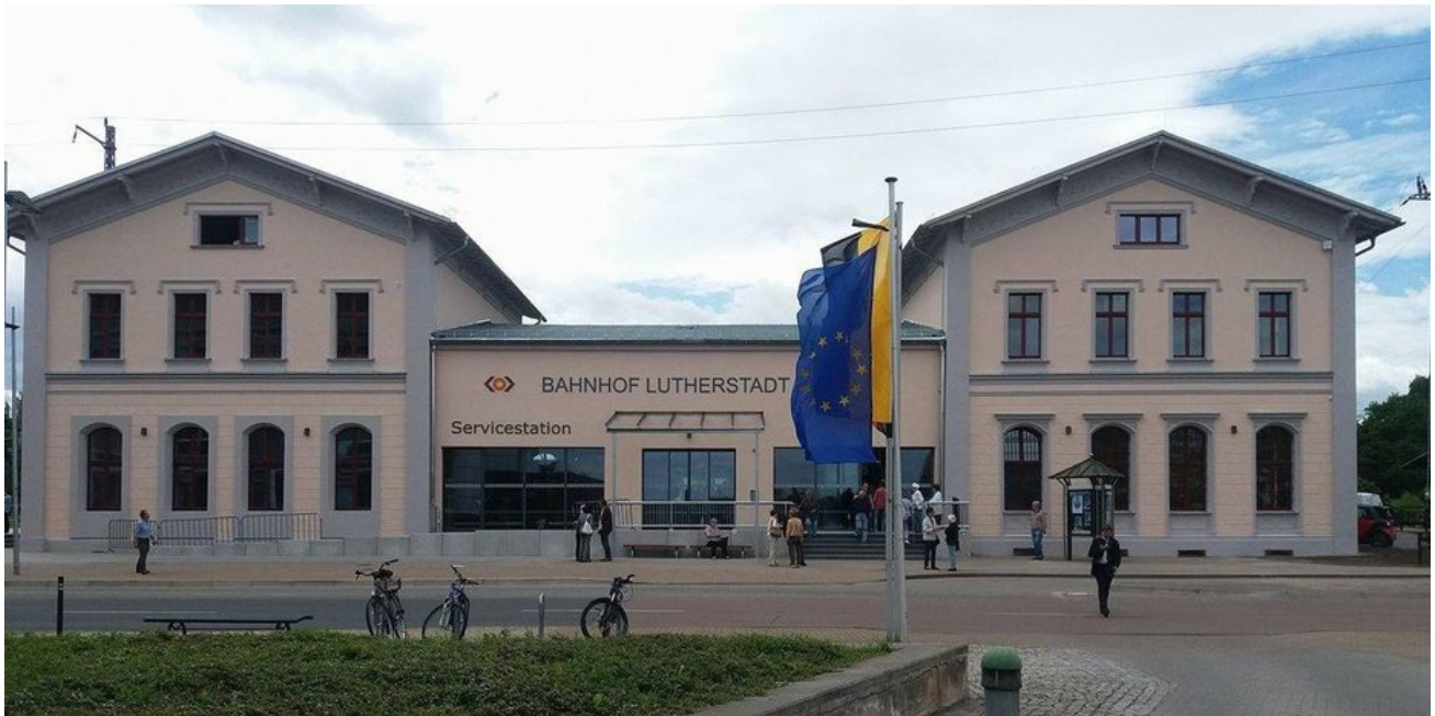
Das Bahnhofsgebäude erstrahlt seit Mai 2017 in neuem Glanz.