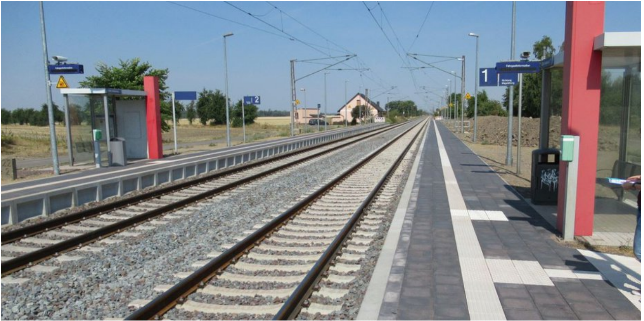
Im Sommer 2018 zeigten sich die beiden Bahnsteige in neuem Glanz.