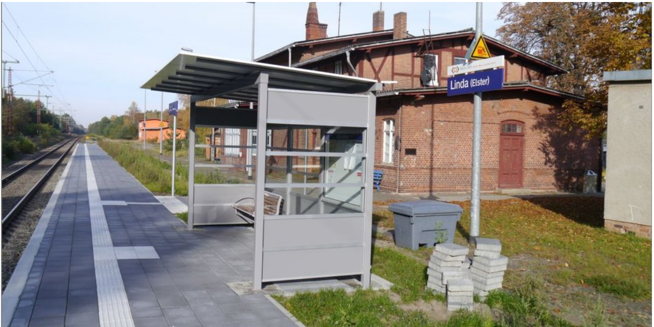
Der modernisierte Bahnsteig zum Ende der Bauphase im Jahr 2015. Jetzt passen im Sommerhalbjahr auch die längeren Züge an den Bahnsteig.