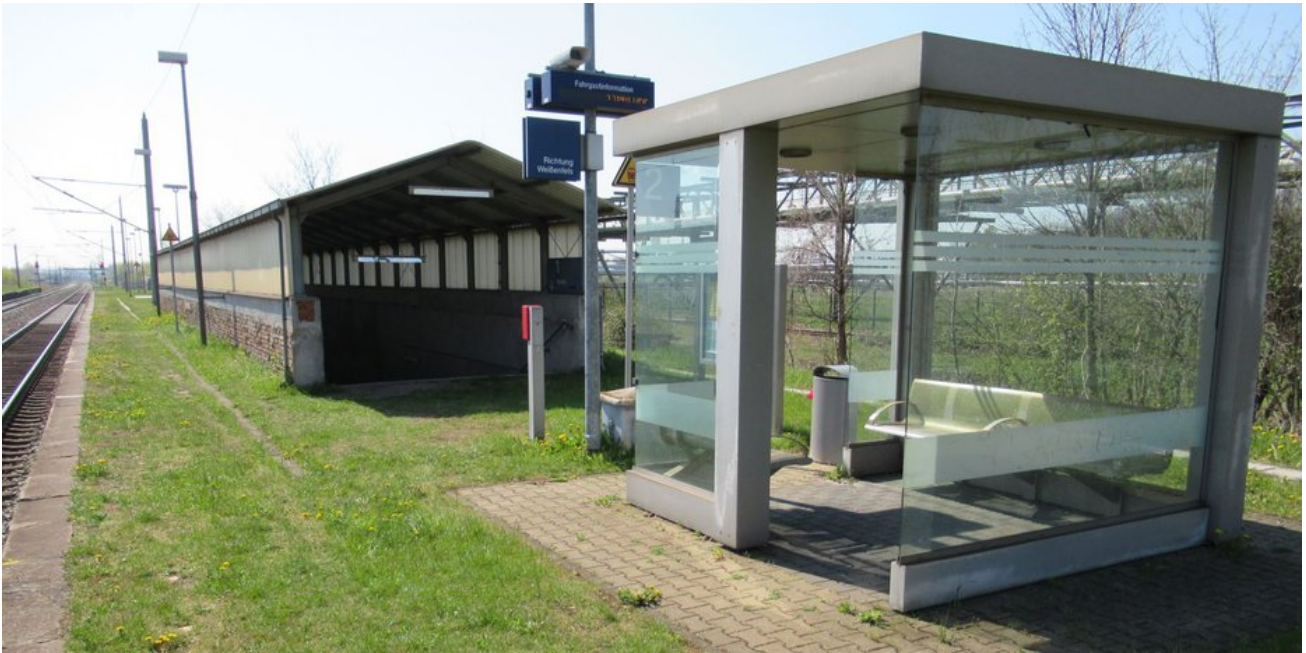
Die Bahnstation ist nur für den Werksverkehr zugänglich und erhält neue Bahnsteiganlagen.