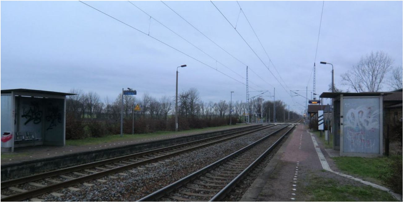
Bahnsteige und Ausstattung haben noch lange keinen S-Bahn-Standard