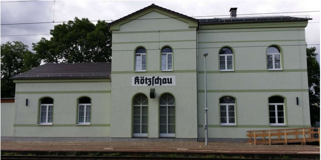
Das Bahnhofsgebäude beherbergt Warteraum, WC und Eisenbahnmuseum.