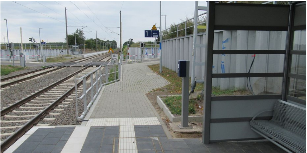
Die neuen Bahnsteige samt Ausstattung sind seit Sommer 2021 nutzbar.