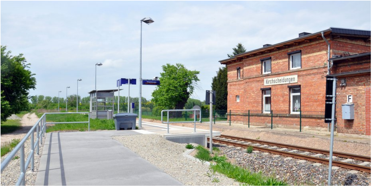
Neuer Bahnsteig auf der Ortsseite