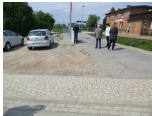
Zugang mit Parkmöglichkeiten