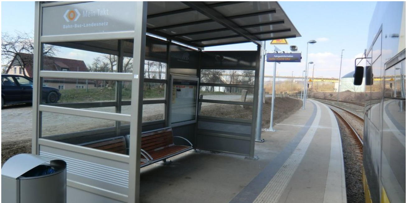
Neuer Bahnsteig nahe der Ortsmitte