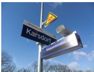
Infosystem mit aktuellen Zuginfos