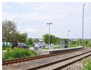
Neue Lage direkt am Bahnübergang