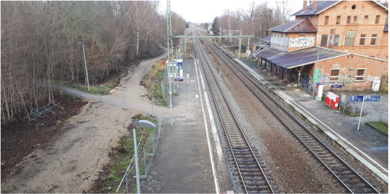
Die Bahnsteige werden im Frühjahr 2023 erneuert, das Bahnhofsgebäude zurückgebaut.