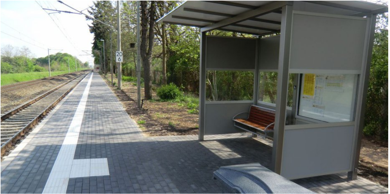
Der neue Bahnsteig Richtung Halle ist seit Sommer 2017 fertig.