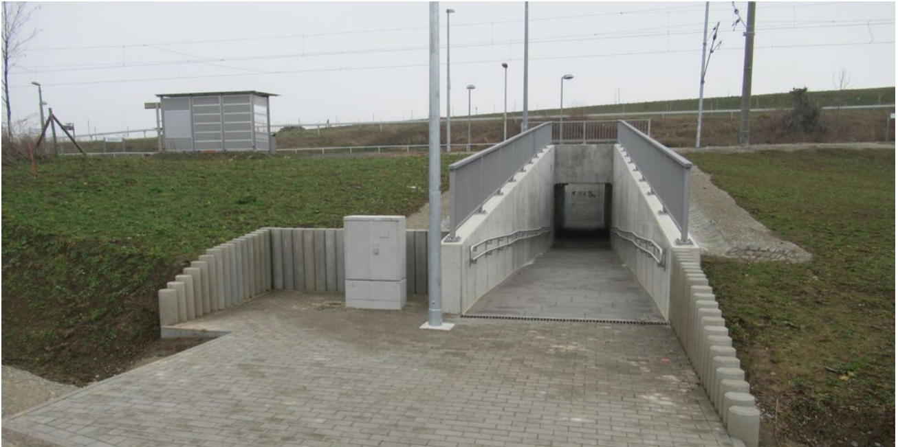
Im Frühjahr 2021 war die neue Unterführung zu den Bahnsteigen in Betrieb.