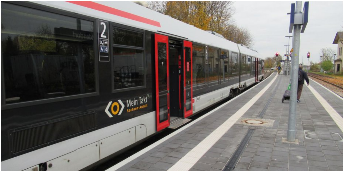
Der neue Mittelbahnsteig wurde 2021 fertiggestellt.