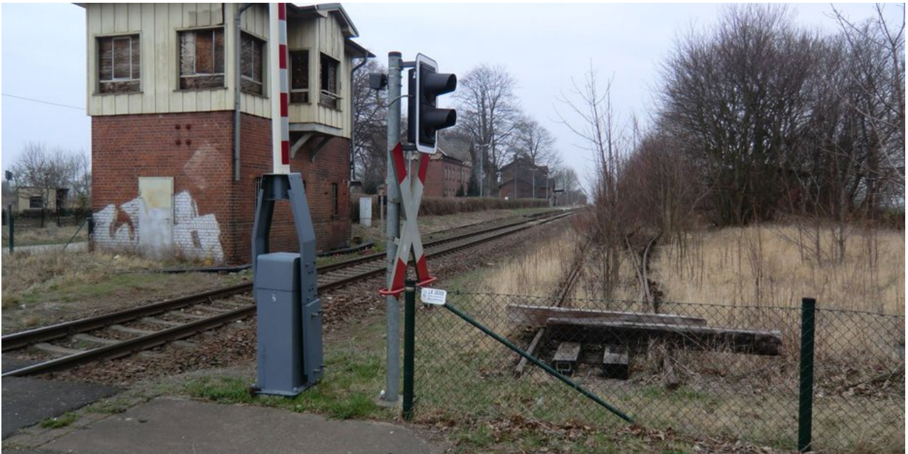
Der neue Bahnsteig wird auf der Ortsseite vor dem Bahnübergang errichtet.