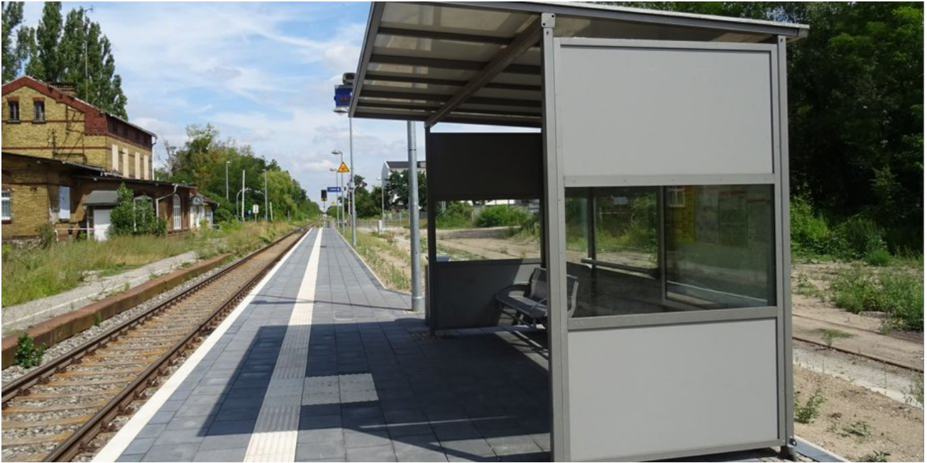
Der neue Bahnsteig auf der südlichen Gleisseite wurde 2019 fertiggestellt.