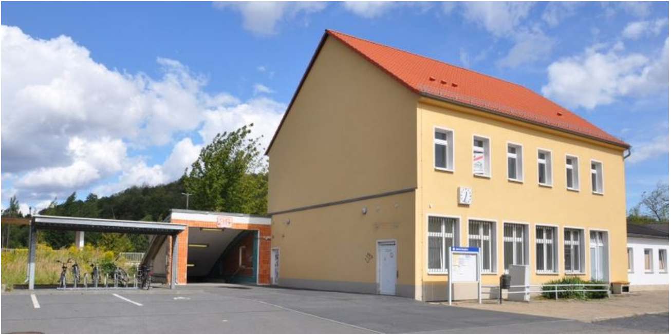
Der Zugangsbereich zum Bahnhof wurde durch den Teilrückbau des Gebäudes neugestaltet