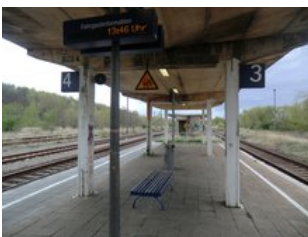
Der Mittelbahnsteig muss dringend erneuert und barrierefrei erschlossen werden.