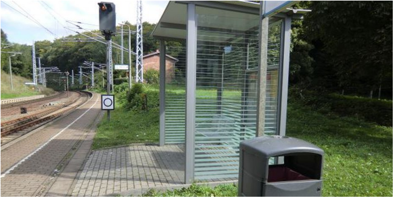
Die Bahnsteige wurden den neuen Zuglängen angepasst und erhielten teilweise neue Oberflächen.