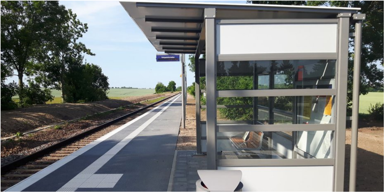
Ein moderner, barrierefreier Bahnsteig für den Magdeburger Stadtteil