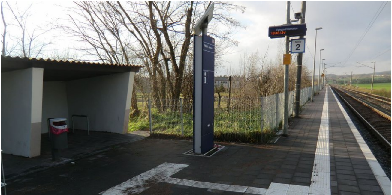
Bis 2018 wurde die Erneuerung der Bahnsteige abgeschlossen.