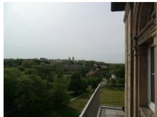
Blick vom Uhrenturm des Bahnhofs zur Innenstadt