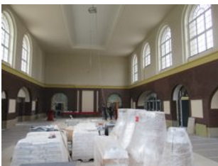
Die Bauarbeiten im Herbst 2021 in der Bahnhofshalle

Das denkmalgeschützte große Gebäude erstrahlt nunmehr in neuem Glanz. Neben Büroflächen konnten Servicebereiche für die Reisenden, ein barrierefreies WC und eine Autovermietung in den Bahnhof einziehen.