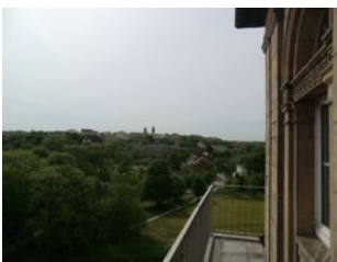
Blick vom Uhrenturm des Bahnhofs zur Innenstadt