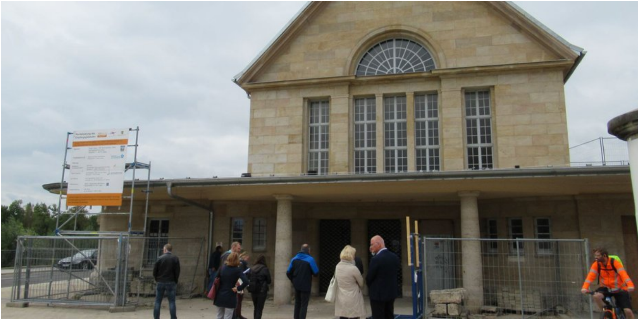
Das imposante Bahnhofsgebäude mitten in der Stadt zwischen Bahndamm und Elsteraue