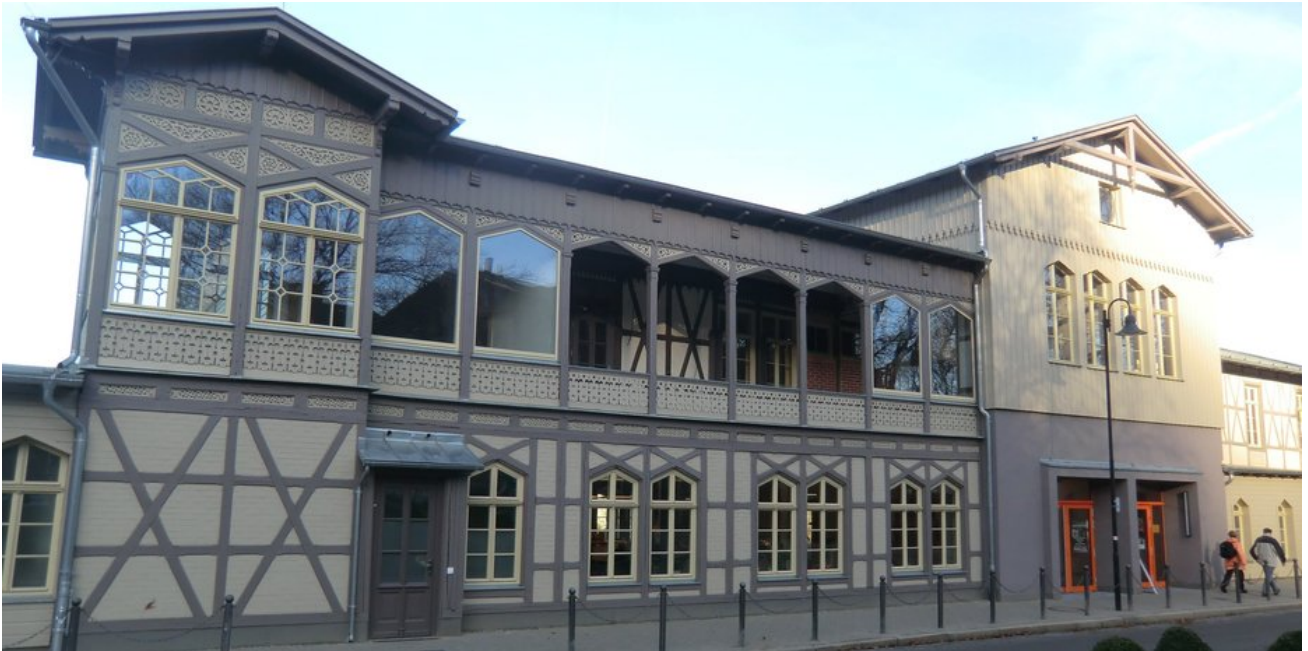
Schmuckstück im Ortszentrum