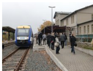
Aus dem Zug in den Bahnhof