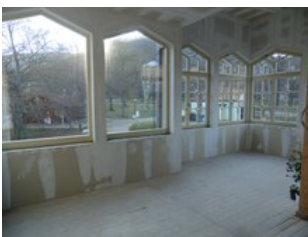
Freie Mieteinheiten im Obergeschoss