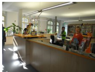
... mit Bodetal-Tourismusinformation