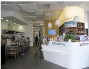
Das Servicezentrum im Bahnhof mit Fahrkartenverkauf, Stadtinfo und Bistro