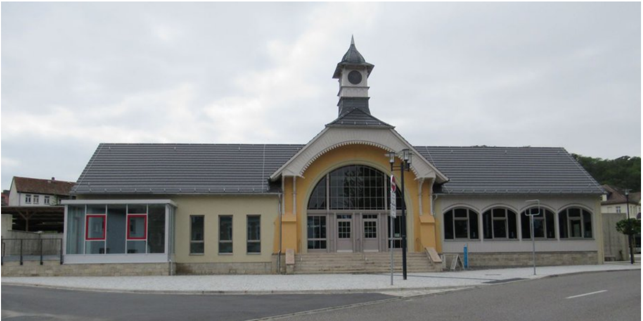
Das Bahnhofsgebäude als Kombination von alt und neu