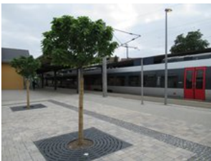
Attraktive Übergänge zwischen Umfeld und Bahnsteig