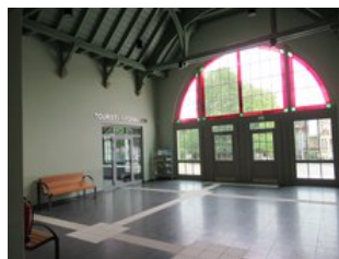
Die Bahnhofshalle erstrahlt in alter Schönheit.