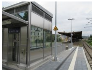
Seit Sommer 2021 ist der Aufzug zum Bahnsteig 2 in Betrieb.