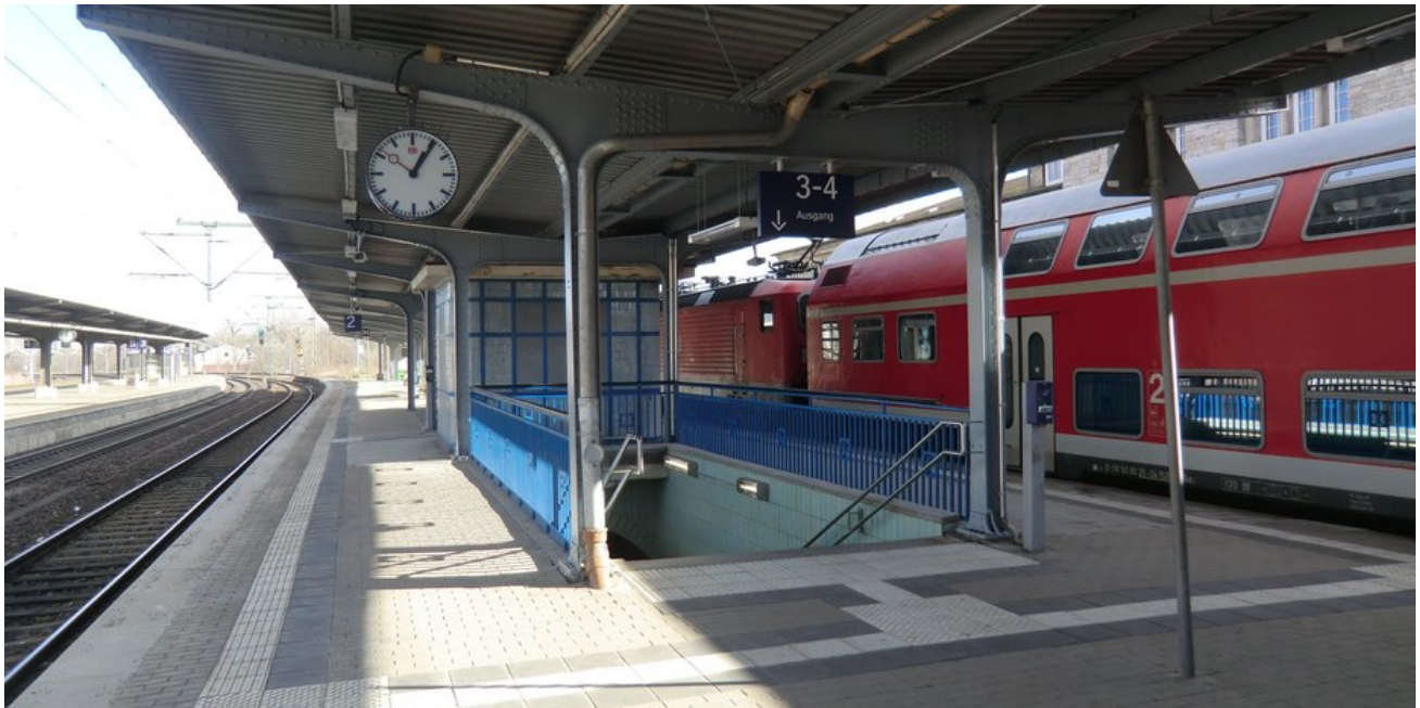
Bahnsteig 1 und 2