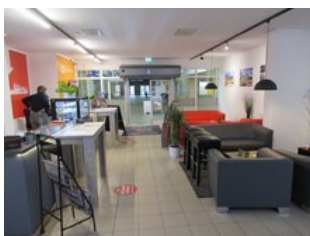
Seit 2019 ist die neue Servicestation mit Fahrkartenverkauf und Bistro in Betrieb.

Projekte im Zusammenhang Realisierung Busbahnhof durch die Stadt Weißenfels an der Promenade Einrichtung eines Mein-Takt-Servicestation im Bahnhofsgebäude (Dezember 2019)