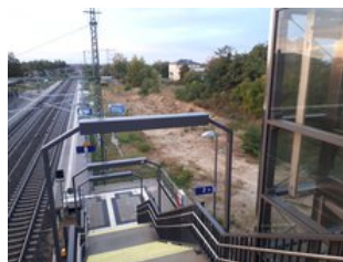
Seit 2020 sind die Aufzüge an der neuen Fußgängerüberführung in Betrieb.

Bahnstrecke Dessau - Magdeburg Dessau - Berlin