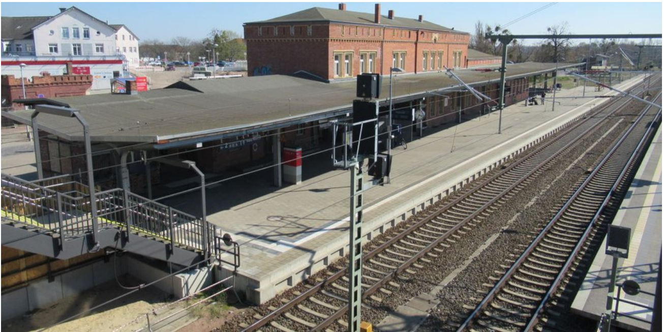
Moderner Bahnsteig am Empfangsgebäude