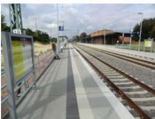
Neuer Außenbahnsteig Richtung Dessau