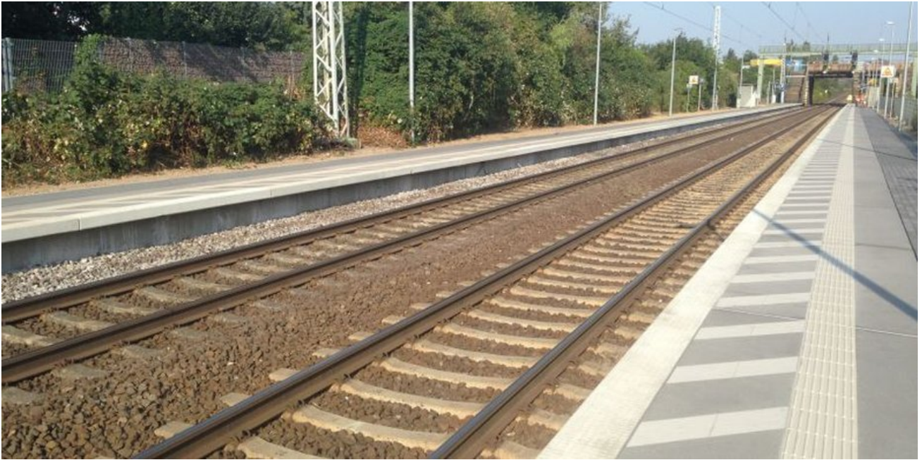
Die neuen Bahnsteigbeläge kurz nach der Fertigstellung