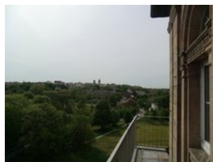
Blick vom Uhrenturm des Bahnhofs zur Innenstadt