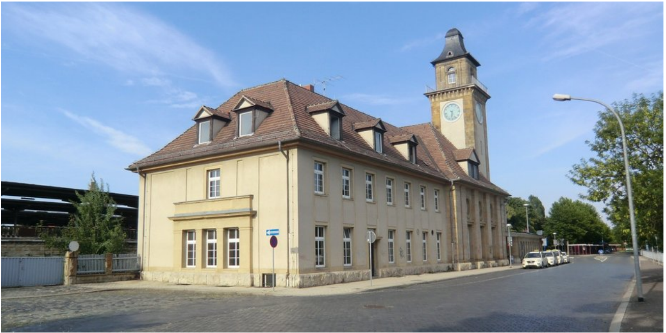
Das imposante Bahnhofsgebäude mitten in der Stadt zwischen Bahndamm und Elsteraue