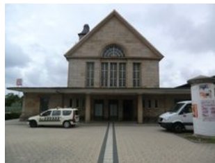
Der Bahnhofszugang vom Busbahnhof