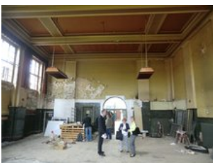
Viel Platz für neue Ideen in der alten Mitropa-Gaststätte