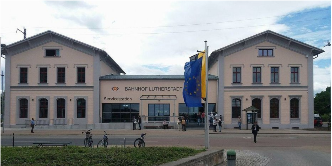
Das Bahnhofsgebäude erstrahlt seit Mai 2017 in neuem Glanz.