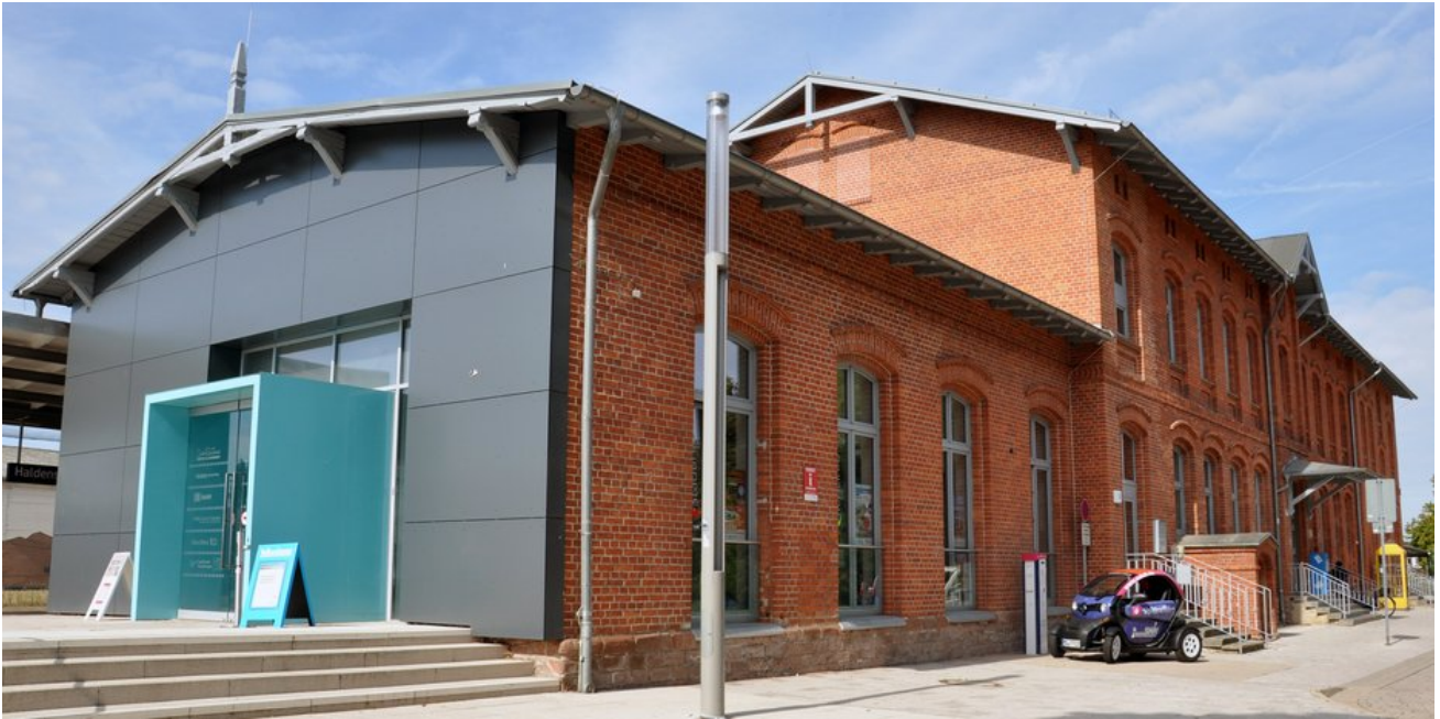
Sanierter Bahnhof mit neuem Zugang